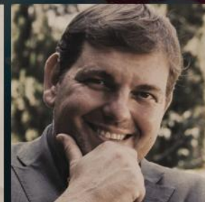
Ambrogio Crespi Regista