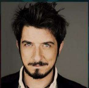
Paolo Ruffini Attore e Regista