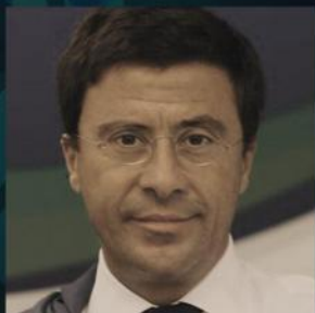
Italo Bocchino Politico