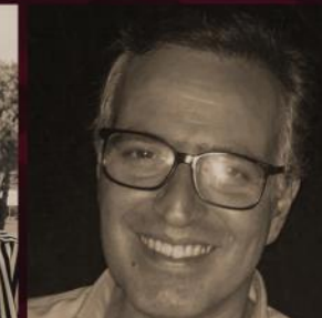
Biagio Semilia Editore